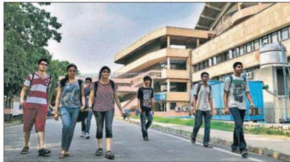
Indian Institute of Management, Bangalore, topped the list of management institutes in the country, in the National Institutional Ranking Framework list for the best institutes of 2019.

education ministry's overall national ranking of higher institutes. Delhi's Jawaharlal Nehru University (JNU) has been placed at number 7.