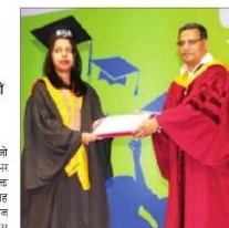
चीफ गेस्ट से डिग्री लेती एक छात्रा

500 से अधिक छात्र-छात्राओं को मेडल व प्रमाणपत्र का वितरण