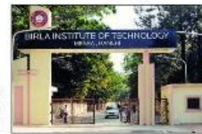
The entrance gate of Birla Institute of Technology (BIT), Mesra, Ranchi. The institute's ranking has plummeted from 60th position in 2018 to 89th position this year.

Ranchi-based Birla Institute of Technology (BIT) Mesra's performance, on the other hand, nose-dived from the 60th position