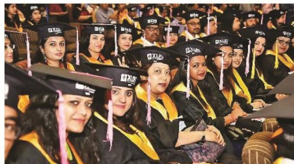
एक्सएलआरआई में शनिवार को एक्जीक्यूटिव प्रोग्राम के 17वें ग्रेजुएशन सेरेमनी में शामिल विद्यार्थी

लॉनिंग सहित अन्य पाठ्यक्रमों के छात्र-छात्राओं को मेडल व प्रमाणपत्र दिए गए। इनमें पोस्ट ग्रेजुएट सर्टिफिकेट इन बिजनेस मैनेजमेंट, पोस्ट ग्रेजुएट सर्टिफिकेट इन ह्यूमन रिसोर्स मैनेजमेंट, पोस्ट ग्रेजुएट सर्टिफिकेट इन बिजनेस एनालिटिक्स, एक्जीक्यूटिव डिप्लोमा इन ह्यूमन रिसोर्स मैनेजमेंट प्रोग्राम, पोस्ट ग्रेजुएट सर्टिफिकेट इन एचआरएम, पोस्ट ग्रेजुएट सर्टिफिकेट इन जेनरल मैनेजमेंट मुंबई के छात्र-छात्राएं शामिल थीं।