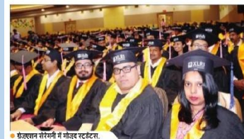
● ग्रेजुएशन सोरेमनी में मौजूद स्टूडेंट्स

दायित्व निभाने के साथ-साथ अतिरिक्त करने की रखें सोच