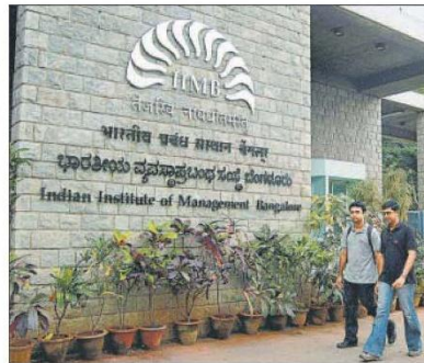
■ IIM Bangalore is the top-ranked B-school in south India

The B-School ranking also focuses on the 'Emerging B-School' category (which includes new business schools from which 5 batches are yet to pass) that are performing well and are recognized. The list also highlights the best