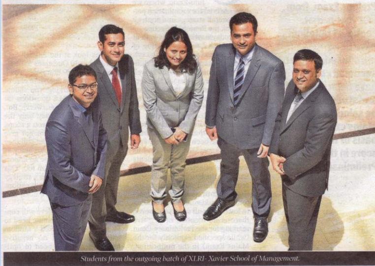
Students from the outgoing batch of XLRI - Xavier School of Management.