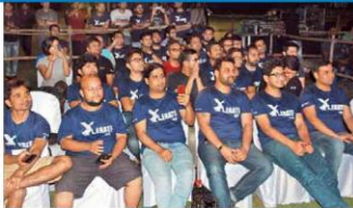
एक्सएलआरआई में आयोजित सत्रों में अला लो गेस्ट।

अजित बहली ने कहा- टेक्नोलॉजी के कारण अपनी मूल्य में बचपन आ रहा है। उस बचपन को सीखकर कर जो बर्तन की जरूरत है। अनुभव और अनुभव से बर्तन- औद्योगिक उद्योग को विनोद बचपन सीखकर बचपन होगा। वहीं, अजित सिनेमा के बर्तन- उद्योग की अपनी मूल्य समझ में और उद्योग व्यवस्थापक समझ दिया गया है। इसके अलावा को लक्ष्य हुआ है।