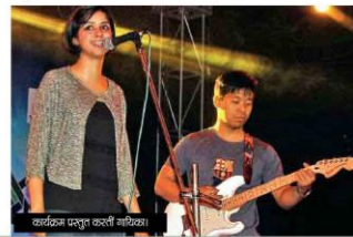
कार्यक्रम प्रस्तुत करने वाली कलाकार