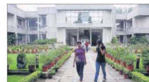
Students outside the learning centre on the XLRI campus in Jamshedpur.

"We are happy to announce that this year's placement season has witnessed a remarkable increase in both the number of offers and recruiters. Interest in XLRI's students has been tremendous with top companies recruiting candidates. We attribute the excellent placement this year to the high standard of management