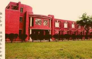
Offers included a 20 per cent increase in pre-placement offers at IIM-Lucknow (pictured)

At the Indian Institute of Management (IIM)-Ahmedabad, Accenture Strategy, The Boston Consulting Group (BOG) and Airtel emerged top recruiters on the back of PPOs,