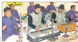
वीरवी विद्यार्थी स्कूल में आयोजित कार्यक्रम में प्रदर्शित करने वाली बंधु व अन्य।