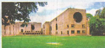
Pay packages have reportedly increased, on average, 10-12 per cent over last year

VSuresh, chief sales officer of Naukri, reports 10 per cent year-on-year growth in hir-