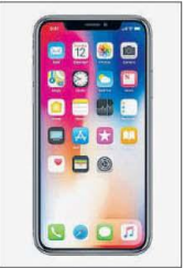
iPhones to get costlier