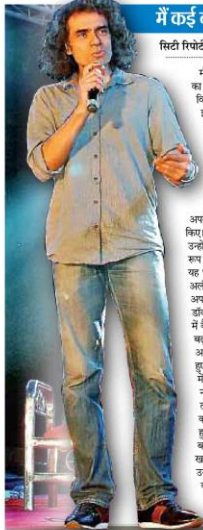
सिटी रिपोर्टर • जमशेदपुर

मोड्यूल और में विनोद उद्योग का रूप ले चुका है। इसके विविध आयाम हैं। बजट बृद्धि इसके इस क्षेत्र में फैलकर बचाने आसान नहीं है। वे बर्तन विनोद निर्देशक इम्तियाज अली ने कहा। वे एक्सएलआरआई में आयोजित एक्सप्लेंट 2018 में बर्तन विनोद सत्र में बोल रहे थे। उन्होंने अपने जीवन के अनुभव शेयर किए। बचपन से आज तक उन्होंने भारतीय सिनेमा को किस रूप में देखा व समझा दिया, यह भी बताया। बर्तन विनोद अली, जवाहर अविभाजक अपने बच्चों को इंग्लिश, डॉक्टर या मैनेजर की दुनिया में भेज कर देते हैं, जबकि अपने बच्चों के हितों वाले चुनते हैं। अली ने बहुरंगीन कलागत देते हुए कहा- वे भी नहीं बड़ा में फल हुए थे, लेकिन पढ़ाई नहीं छोड़ी। शहर से दिल्ली तक विनोद विनोद बर्तन कठिनाई का सामना करते हुए शराब पर पैर पकाने बर्तन। आज वे मुकाम पर खड़े हैं तो सिर्फ इसलिए कि उन्होंने न सिर्फ हार से निपटाया को पूरा रखा, बल्कि गलतियों से सीखकर अपने बर्तन किए।