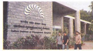
IIM Bangalore has received 150 pre-placement-offers before the start of the final placement scheduled for this weekend. MINT

Along with the quality of teaching, the economy was cited as a reason for the strong