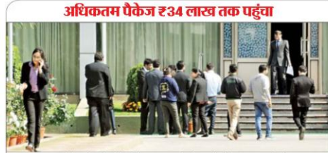
एक्सएलआरआइ में कैपस रिक्रूटमेंट प्रॉसेस के दौरान साक्षात्कार के लिए अपनी बारी का इंतजार करते स्टूडेंट्स.

एक्सएलआरआइ में बुधवार को उद्घाटन कार्यक्रम दिखी. कैपस के लिए कॉन्फ्रेंस, मार्केटिंग, एफएमसीजी, फाइनेंस, ऑपरेशन से जुड़ी कंपनियों के प्रतिनिधियों ने अलग-अलग कक्ष में साक्षात्कार लिया. कैपस में हिस्सा लेने