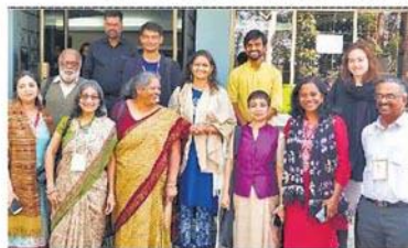
एक्सएलआरआई में सम्मेलन के दूसरे दिन मौजूद अतिथि व अन्य।