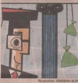
Illustration: ANSHU BORA

₹20 lakh-plus packages. Seen at more business schools. Offered by more recruiters. More in number as well.