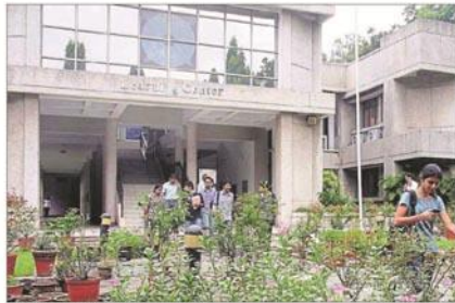
Students at the XLRI campus in Jamshedpur.

PUBLICATION: Hindustan Times DATE: 10 February 2019 EDITION: Jamshedpur PAGE: 3