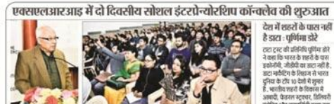
एक्सएलआरआई में सोशल इंटरप्रेन्योरशिप कॉन्क्लेव की शुरुआत

एक्सएलआरआई में दो दिवसीय सोशल इंटरप्रेन्योरशिप कॉन्क्लेव की शुरुआत देश में शहरों के पास नहीं है अतः पूर्णगम से देश टार की शक्तिपूर्ण हो ने बाद कि शहर के विकास में बाधक बन रहा है. शहरों के विकास में बाधक बन रहा है. शहरों के विकास में बाधक बन रहा है. शहरों के विकास में बाधक बन रहा है.