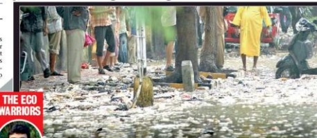
THE ECO WARRIORS