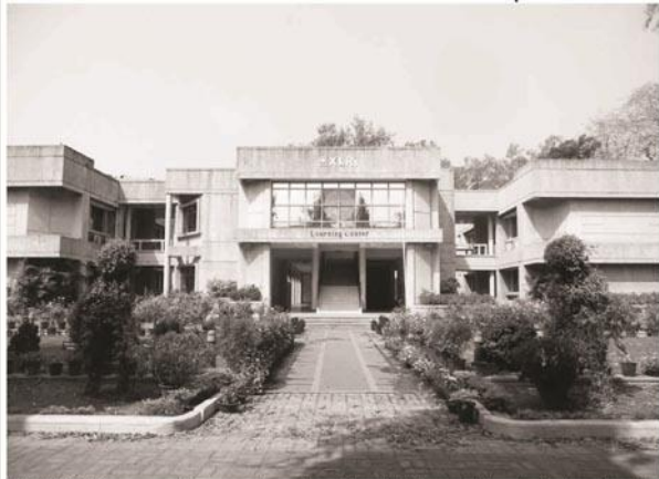
PNS at JAMSHEDPUR

Xavier School of Management (XLRI) has successfully achieved 100% placements for the outgoing batch of 2017-19 in its flagship programme Two-year Postgraduate Diploma in Management - HRM and BM, with all 358 candidates securing offers through the final recruitment process in two days.