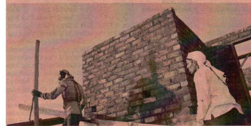
SOMESH JHA New Delhi, 15 February

The biggest benefit from a hike in the minimum wage, as proposed by a government-appointed expert panel recently, would go to workers in at least 10 states.