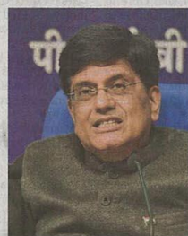
Poll bugle Piyush Goyal

But much of these huge additions could be due to increasing formalisation and not reflective of jobs creation. At the same time the widely contested revised GDP