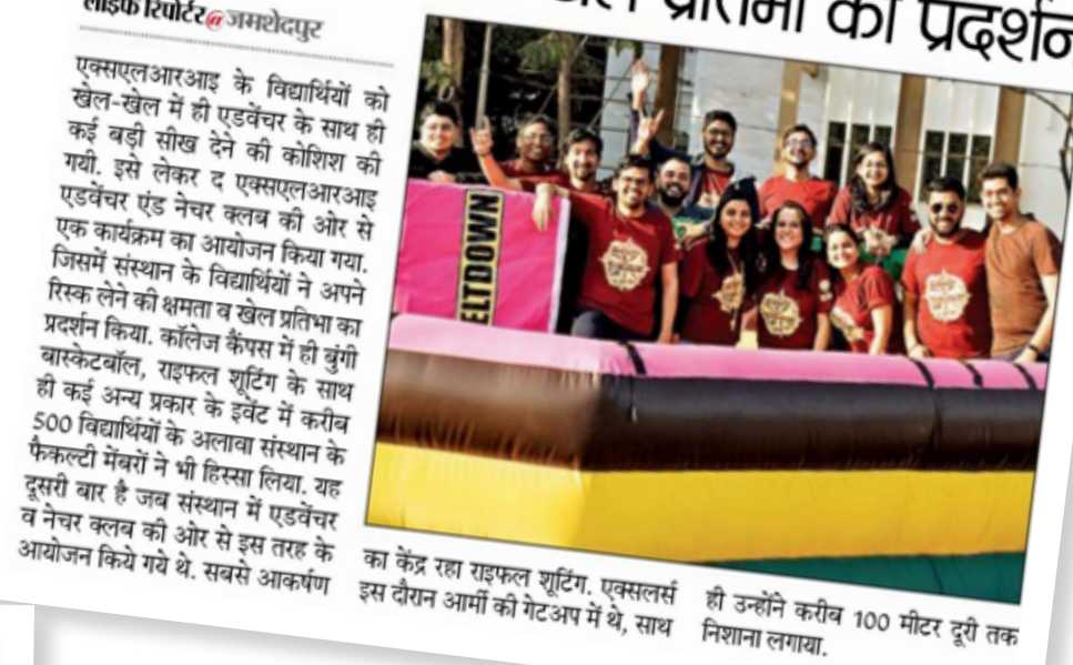
आयोजन किये गये थे. सबसे आकर्षण इस दौरान आमीं की गेटअप में थे, साथ निशाना लगाया.

एक्सएलआरआइ के विद्यार्थियों को खेल-खेल में ही एडवेंचर के साथ ही कई बड़ी सीख देने की कोशिश की गयी. इसे लेकर द एक्सएलआरआइ एडवेंचर एंड नेचर क्लब की ओर से एक कार्यक्रम का आयोजन किया गया. जिसमें संस्थान के विद्यार्थियों ने अपने रिस्क लेने की क्षमता व खेल प्रतिभा का प्रदर्शन किया. कॉलेज कैंपस में ही बुंगी वास्केटबॉल, राइफल शूटिंग के साथ ही कई अन्य प्रकार के इवेंट में करीब 500 विद्यार्थियों के अलावा संस्थान के फैकल्टी मेंबरों ने भी हिस्सा लिया. यह दूसरी बार है जब संस्थान में एडवेंचर