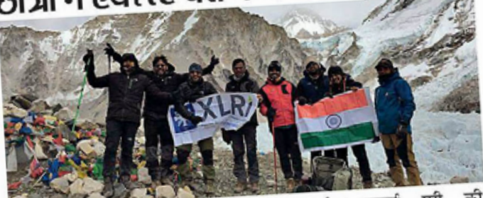
सिटी रिपोर्टर | जमशेदपुर

एक्सएलआरआई समेत बी स्कूल के 220 छात्रों ने एवरेस्ट बेस कैंप की चढ़ाई की