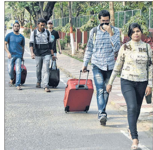
SUDDEN BREAK: Students of IIT(ISM), Dhanbad, leave hostels for their hometowns on Monday. (Gautam Dey)

While the premier B-school asked students of its flagship programmes to join classes from June, the management development programme has been suspended till May.