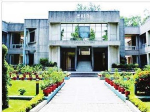
grammes till further notice. Earlier, Xavier School of Management (XLRI) postponed its 64th annual con-

XLRI Jamshedpur have decided to end up its academic session early in view of the coronavirus risk. XLRI has now decided to suspend its ongoing corporate and management pro-