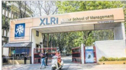
एक्सएलआरआई को किया गया बंद तथा को-ऑपरेटिव कॉलेज में कोरोना को लेकर परीक्षाओं को दूरी बनाकर बैठाया गया.