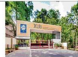
एक्सएलआरआई गेट • जागरण