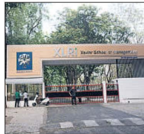
XLRI campus (Bhola Prasad)

deeply regret to inform you that the much-awaited Convocation 2020 stands postponed. We had to take this painful decision of postponing the convocation following advisory from the local authorities and the inputs from our stakeholders on the ongoing situation arising out of the novel coronavirus (COVID-19) outbreak."