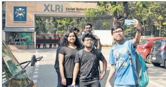
XLRI students click selfies as they leave the campus in Jamshedpur on Tuesday.

Ranchi airport sees nearly 6,000 fliers daily. It has 29 flights to key cities, including metros. But fliers to and from Ranchi have dropped by 10 per cent due to the virus scare.